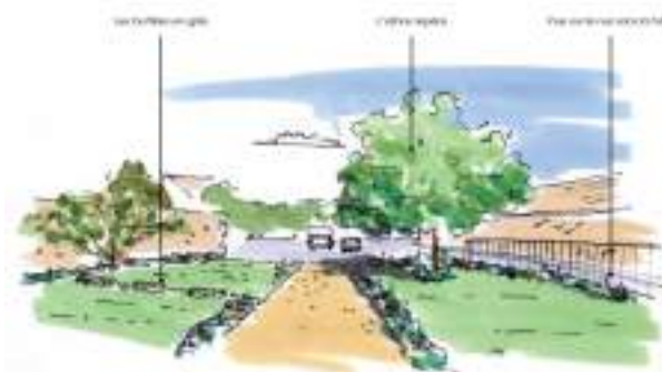
Vue depuis la Mairie

Cette future création a fait l'objet d'une étude paysagère par le Parc Naturel Régional du Gâtinais français. Ces travaux se feront prochainement et pourront être subventionnés dans le cadre de la DETR (Dotation d'Équipement des Territoires Ruraux) entre 20 et 80 % du montant HT des travaux.